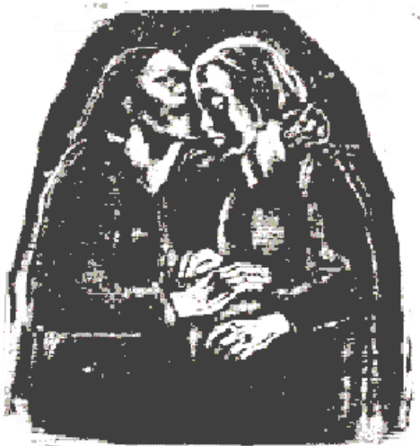
"Ontmoeting, die hoop bevestigt"

Orde voor de dienst van zondag 17 december 2006 de derde zondag van advent: Verheugt U! (Gaudete)